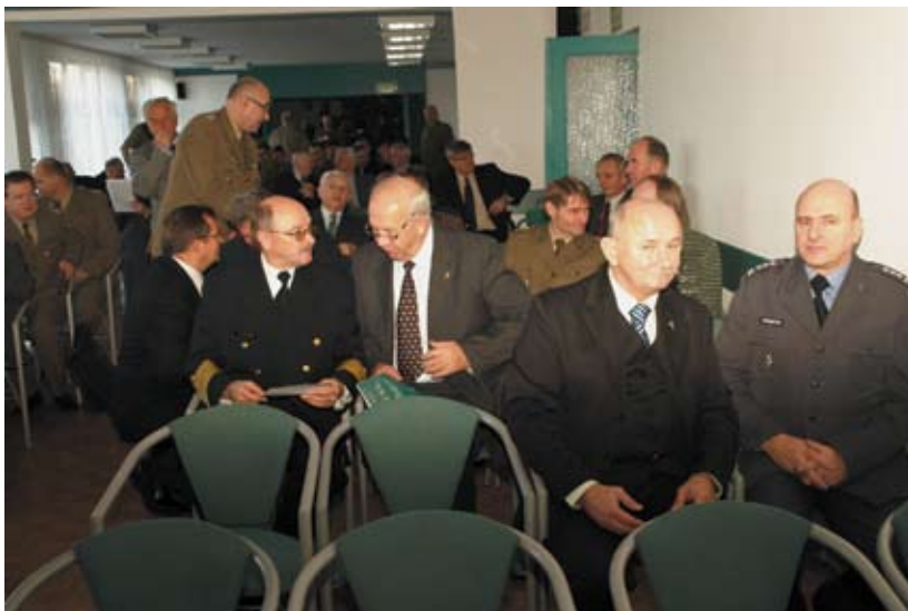
Na sali obrad