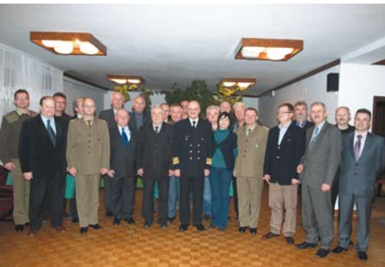
Rada Lekarska Wojskowej Izby Lekarskiej V kadencji.