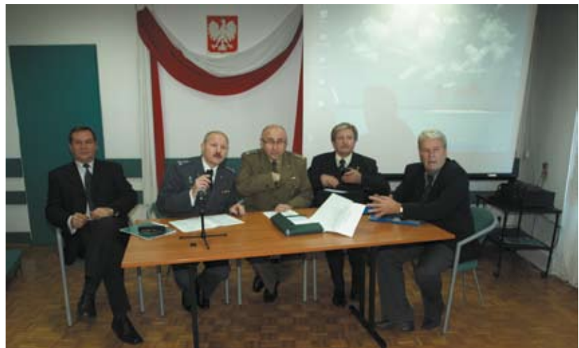
Prezydium XXVI Zjazdu

W dowód uznania, za lata pracy w Wojskowej Izbie Lekarskiej i na rzecz wojskowego środowiska lekarskiego, z okazji XX-lecia WIL, Minister Obrony Narodowej, Bogdan Klich wyróżnił medalami